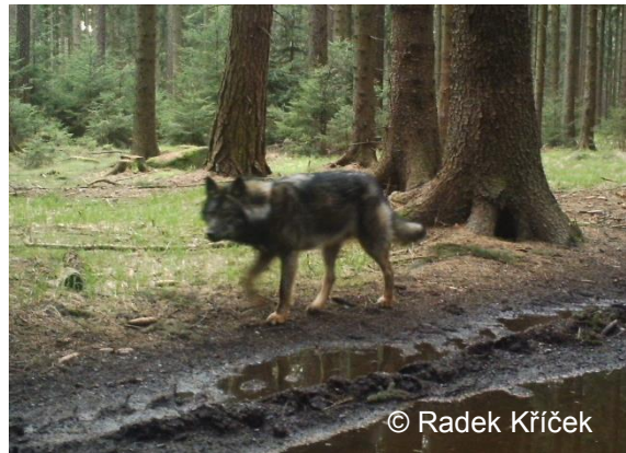
Abb. 2: Fotofallenaufnahme des Hybriden im April 2017

Allerdings gelang die Tötung des Hybriden in Tschechien bislang nicht. Aktuelle Nachweise aus dem April 2017 zeigen, dass das Tier noch immer in der Region unterwegs ist. Es hat eine deutlich dunklere Fellzeichnung als Wölfe, sodass es optisch gut erkennbar ist. Es kann nicht ausgeschlossen werden, dass das inzwischen einjährige Tier in nächster Zeit aus dem Gebiet abwandert und eventuell im Freistaat Sachsen auftaucht. Im Managementplan für den Wolf in Sachsen ist geregelt, dass Hybriden aus der Population entfernt werden sollen. Ein höheres Gefährdungspotenzial für Menschen geht durch Hybriden, die in freier Wildbahn von einer Wolfsmutter aufgezogen wurden, nicht aus, wie internationale Erkenntnisse zeigen.